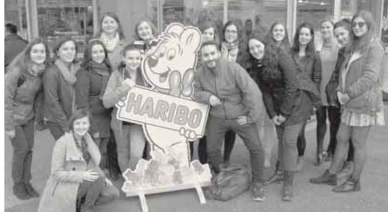
EXKURSION NACH BONN UND KÖLN