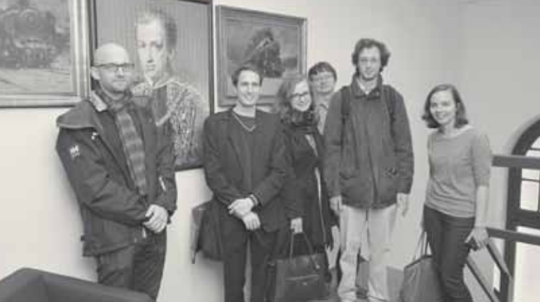
BESICHTIGUNG DES MASARYK-SALONS AM MASARYK-BAHNHOF IN PRAG AM ENDE DES SEMESTERS