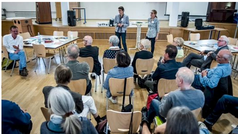
Interessierte Anwohner diskutierten bei der Offenen Geschichtswerkstatt im Leo-Statz-Berufskolleg.