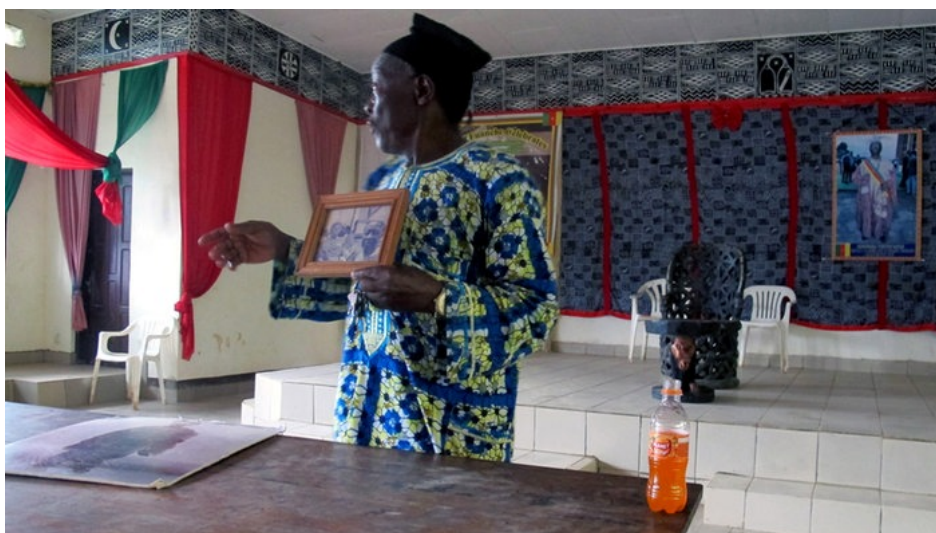
In Kamerun lebt die Geschichte von Magi Kuana (Gustav Conrau) und König Asunganyi bis heute fort.

Eine berühmte Heldengeschichte sei zum Beispiel die des Königs Fon Asunganyi. Der gab dem Deutschen Gustav Conrau, der im Auftrag des Düsseldorfer Zintgraffs unterwegs war, 66 Träger mit. 1899 kam Conrau wieder und wollte erneut Männer rekrutieren. Die 66 Träger jedoch waren verschwunden, Asunganyi hatte gehört, dass sie gestorben wären. Conrau wurde gefangen genommen, floh und starb bei der Flucht.