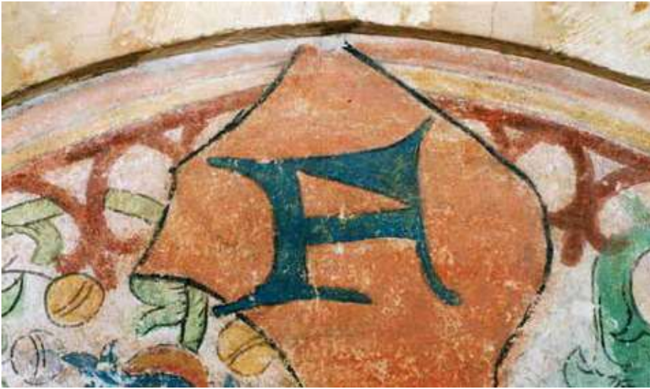
Abb. 14.2: Bogenfeld mit der Bibliothekssignatur F

St. Godehard. Wandschmuck und Buchbestand stellten also eine Art Gesamtensemble dar. 20