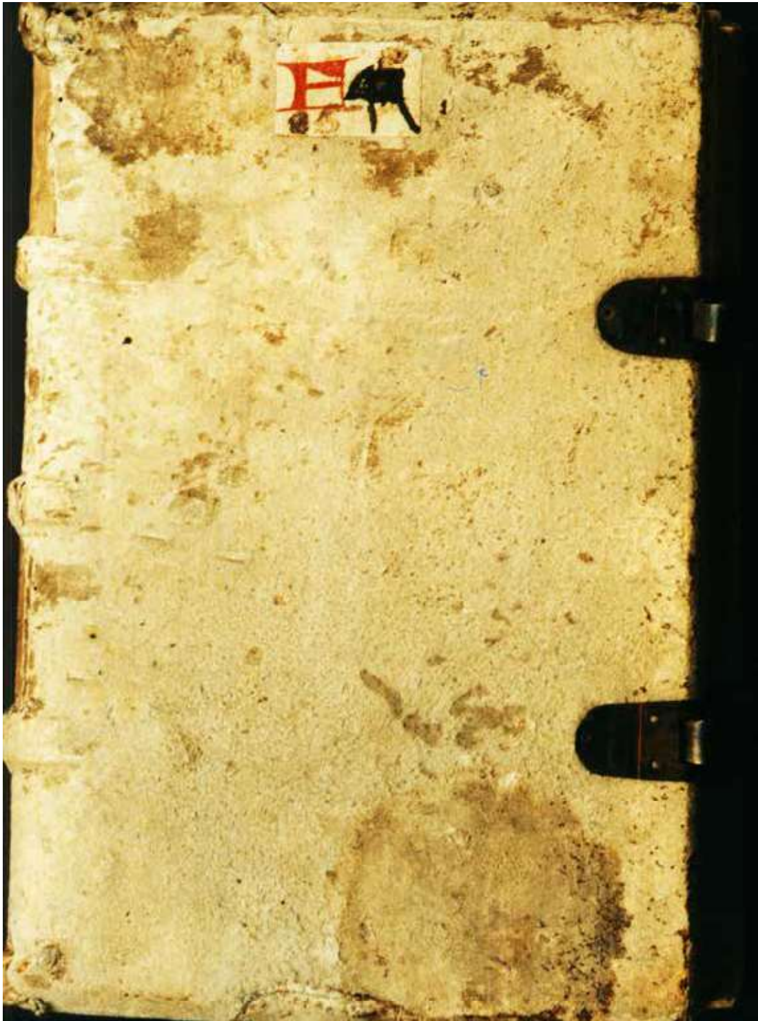
Abb 14.3 Preidigten des Franziskaner Bernardinus von Siena (14th./early 15th c., Dombibliothek Hildesheim, St. God. 34) mit der Sigantur der Godehardbibliothek F 44. Sie wurde im Laufe des 15. Jahrhunderts umsigniert zu F 85, als die geistliche Literatur im Laufe des 15. Jahrhunderts enorm zunahm.