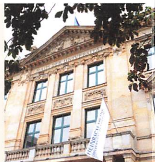
Haus der Universität in Düsseldorf