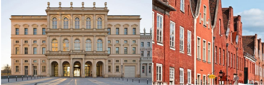
Barberini und Holländisches Viertel