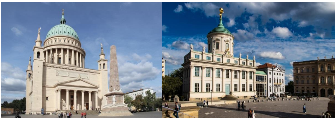
Alte Nikolaikirche & altes Rathaus