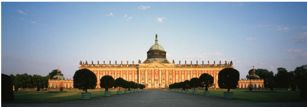
Das neue Palais